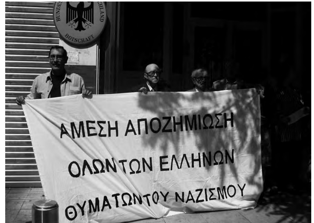
Proteste griechischer NS-Opfer vor der deutschen Botschaft in Athen

Die Zukunft sieht nach europäischer Erinnerungskultur aus: Ende März wurde eine deutsch-italienische Historikerkonferenz zum Zweiten Weltkrieg mit dem Ziel des Aufbaus einer „gemeinsamen Gedächtniskultur“ eingerichtet, die in der Villa Vigoni in Como/Italien stattfindet. Eben diese Villa wurde zur Sicherung der Ansprüche der Distomo-Kläger bereits gepfändet. In Zeitungsinterviews hatte Außenminister Steinmeier bereits ein Museum in Aussicht gestellt: Das sei es, was die Opfer wirklich brauchen.