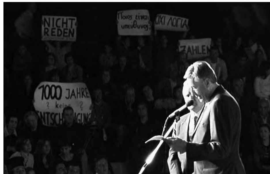
Proteste bei der Ansprache des deutschen Botschafters in Distomo