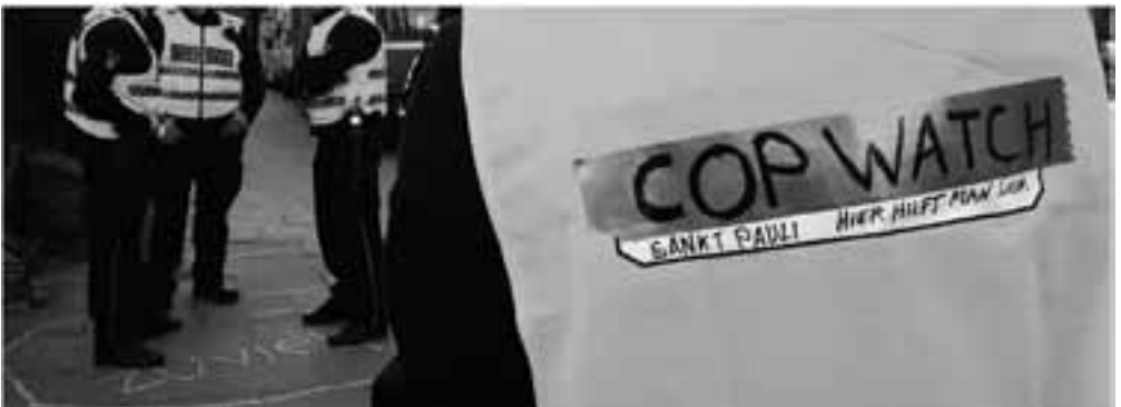
Die Streifenpolizei in gelben Warnwesten wird begleitet von Sirenen-Geheul der Anwohner*innen und Solidarischen: »Wiu-wiu-wiu«