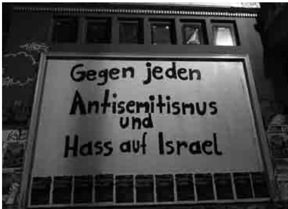
Foto: Rote Flora seit 5. Oktober