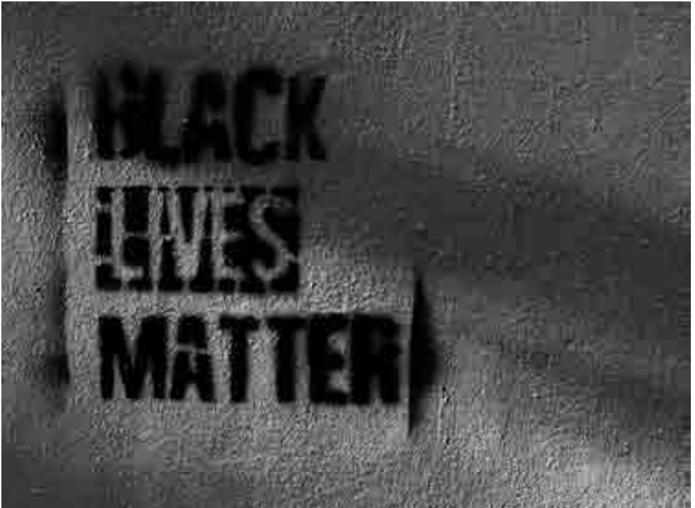
Foto: Sprühfarbe auf Wand

von den ihm zugrundeliegenden materiellen Gewalt- und Herrschaftsverhältnissen stattfindet, die diese nur reproduziert. Der biologische Rassismus ist weiterhin existent, wie das „racial profiling“, die erhöhte Wahrscheinlichkeit als „schwarze“ Person oder PoC von Polizist_innen erschossen zu werden und der Check des „Migrationshintergrundes“ – der in Stuttgart und jüngst auch in Hamburg als Stammbaumforschung daherkam – als gängige Polizeipraktiken aufzeigen. Und auch im alltäglichen kapitalistischen Konkurrenzkampf wird offen und verdeckt rassistisch begründet, warum eine bestimmte Person bspw. für einen Job oder eine Wohnung als „geeignet“ gilt und eine andere nicht – „Qualifikation“ ist eben nicht, wie die bürgerliche Ideologie verspricht, nur „Bildungs“-Sache. Sowohl dezidiert biologistische als auch verdeckt kulturalistische Muster kommen dabei immer wieder zum Tragen.